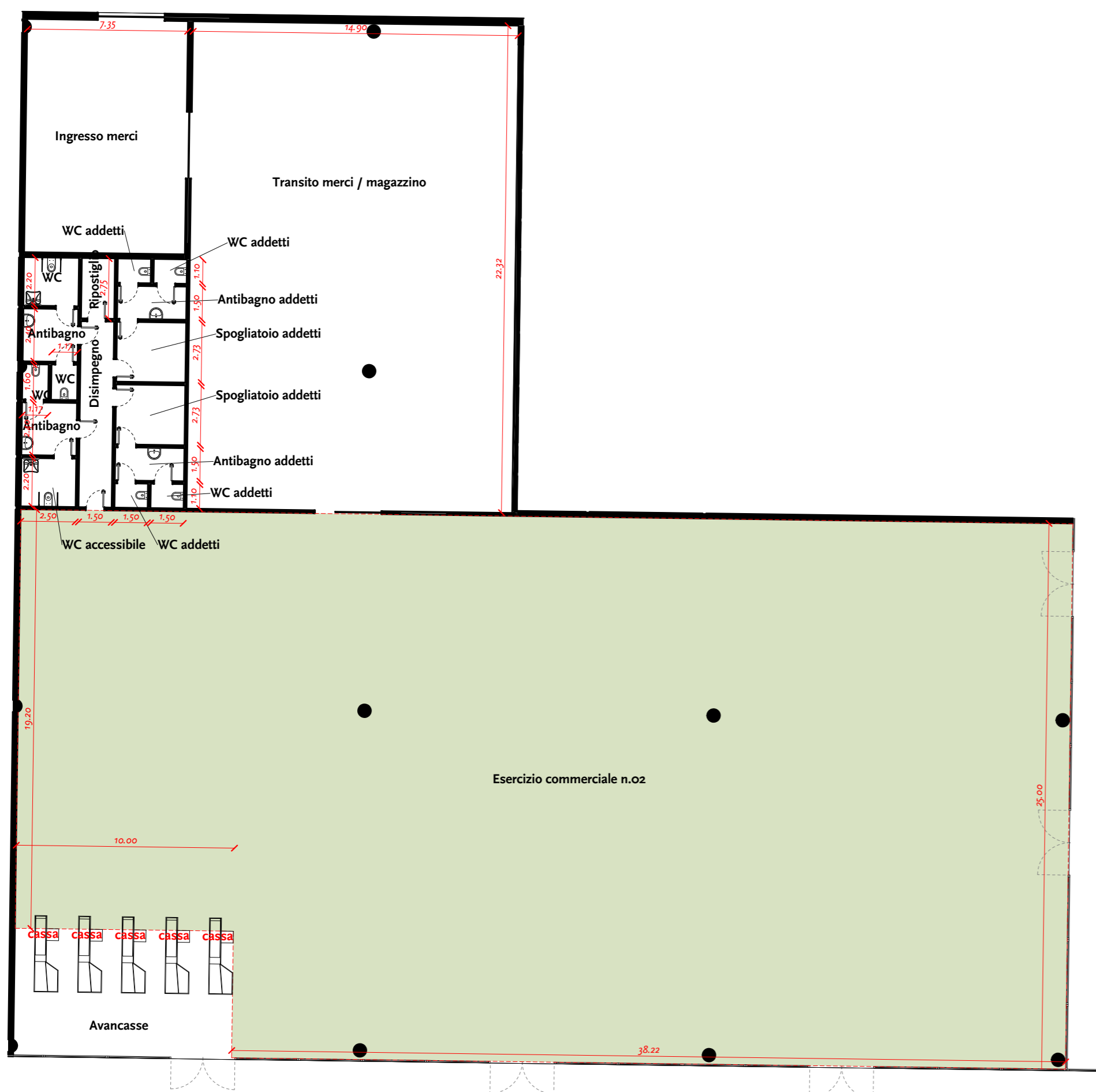
Pianta attività commerciale n.02 - sc. 1:200

Legenda Superficie di vendita dell'esercizio commerciale n.01 pari a 1.147,50mq