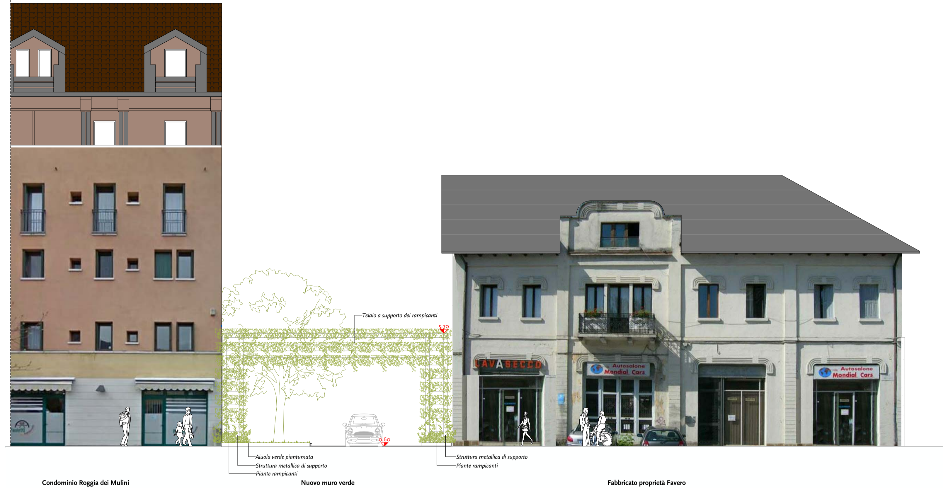
Prospetto lungo Viale Piave